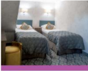
Cabine lits jumeaux Intérieure