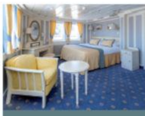
Suite Propriétaire avec passerelle privée