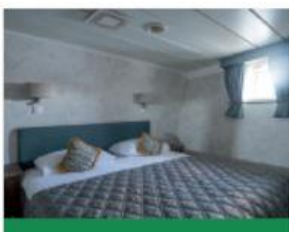
Cabine double supérieure