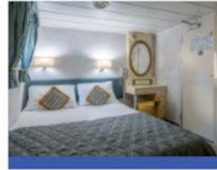
Cabine double standard