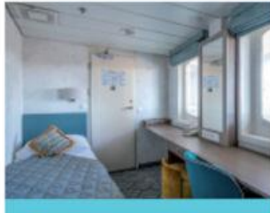
Cabine individuelle standard