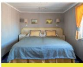
Cabine double Deluxe