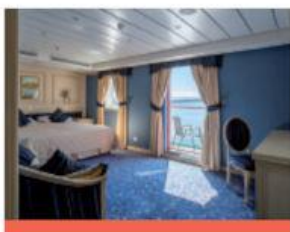
Suite Executive avec balcon