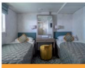
Cabine lits jumeaux supérieure