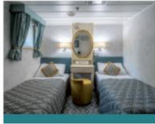
Cabine lits jumeaux standard