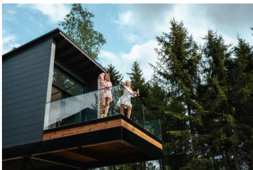
Forest Suite, 33 m 2

POURCH, 4 m 2 ROOM, 16 m 2 BATHROOM, 4 m 2 SAUNA, 2 m 2 BALCONY, 15 m 2